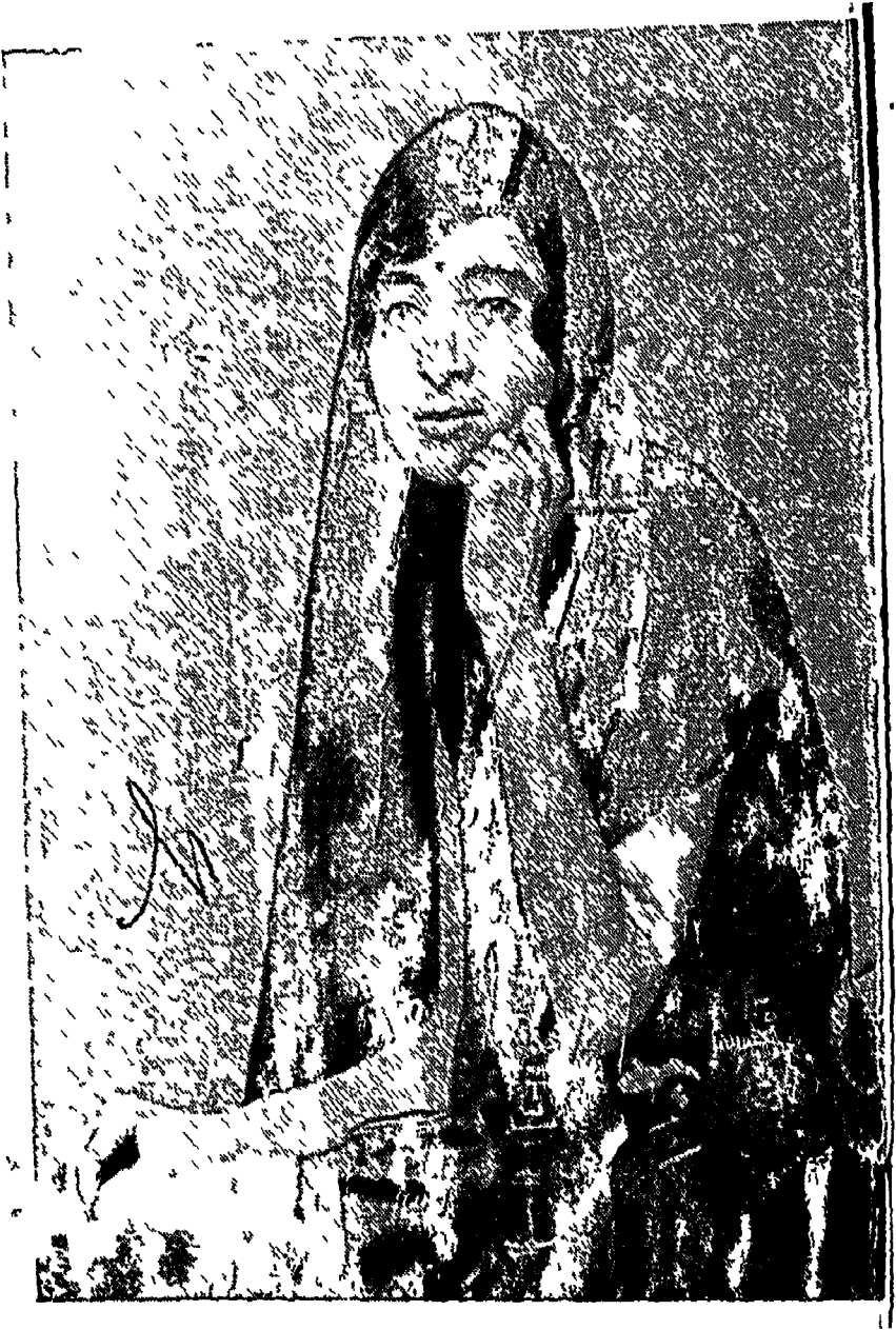
श्रीमती कमला नेहरू